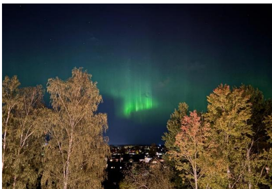
Nordlichter Ausblick aus unserem Wohnzimmer

Die Universität Örebro garantiert jedem Studierenden eine Unterkunft. So kann man ganz stress frei alles planen. Bei der Bewerbung kann man seine Wohnheim Präferenz angeben. Es gibt die Möglichkeiten im „Pine“, „Bricklane“, „Forskaten“ oder im „Oak“ zu wohnen. Alle