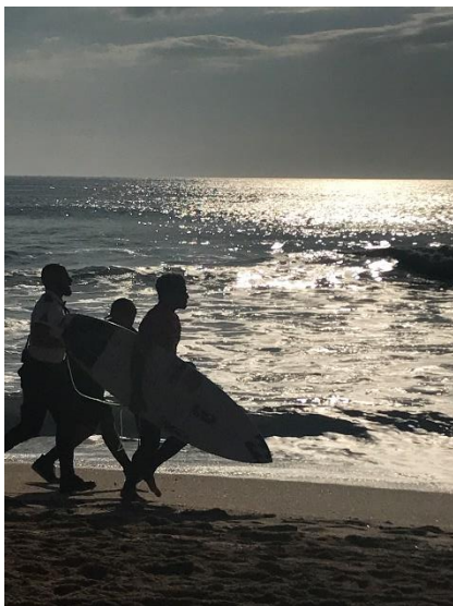
Surf World Championship Peniche

Insgesamt war das halbe Jahr im Ausland eine super Erfahrung und ich kann jedem nur empfehlen ein Auslandssemester zu machen und ich denke, dass Lissabon die perfekte Stadt für ein ERASMUS-Semester ist. Die ISEG bietet gute Kurse an, Lissabon und Portugal haben einiges zu bieten und das Wetter ist ganzjährig sehr gut.