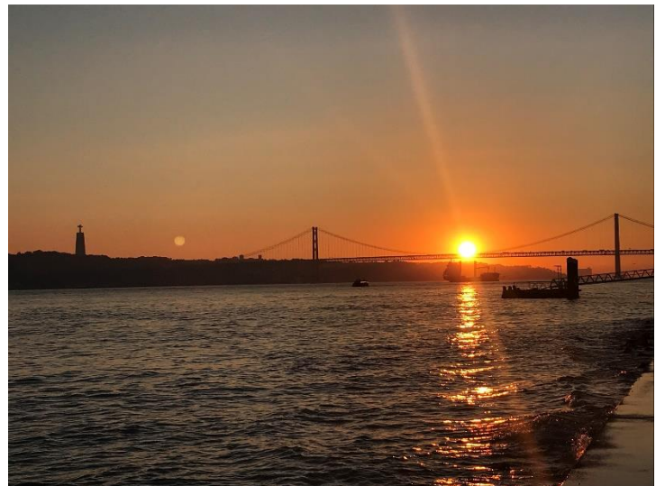
Sonnenuntergang am Fluss Tejo

Neben dem Studium bleibt natürlich auch genügend Freizeit. Bis Ende Oktober hat es kein Mal geregnet und es waren fast durchgehend um die 30 Grad. Aber auch von November bis Januar gab es nicht viel Regen und die Temperaturen lagen im Januar teilweise noch bei knapp unter 20 Grad. Kälter als 10 Grad war es nie.