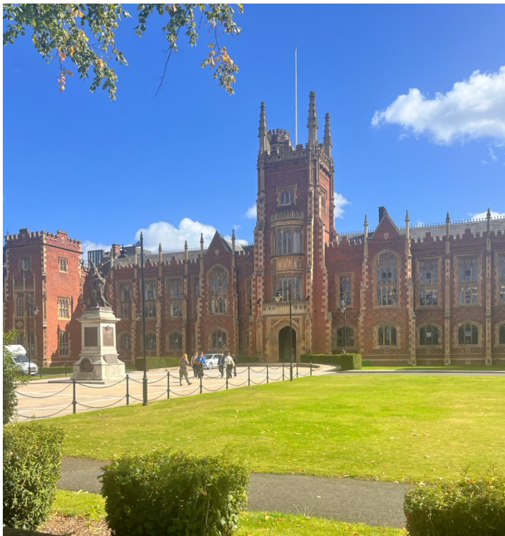
Hauptgebäude der Universität

Positiv fand ich, dass die Note nicht zu 100% von einer Klausur am Ende abhängt, sondern mindestens immer zwei Assignments pro Semester stattfinden. Bei mir waren das z.B Gruppenpräsentationen, Essays oder Class Tests über das Semester verteilt.