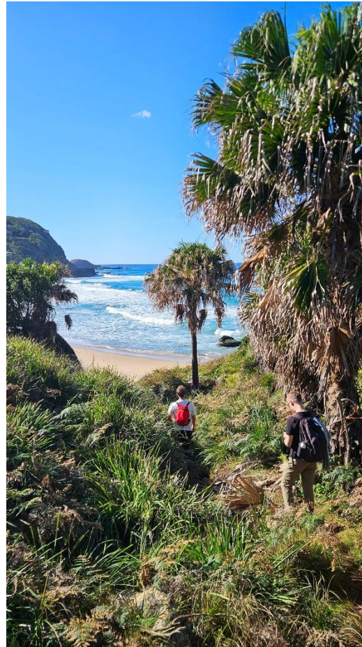
Wanderung zu den Figure Eight Pools

Um Wildtiere zu sehen, eignet sich ein Ausflug ins Kangaroo Valley, hier sind jedoch ebenfalls ein Auto und ein paar Stunden Fahrzeit nötig. Auch die bekannteren Blue Mountains lassen sich von Wollongong gut per Auto erreichen und bieten weitere atemberaubende Ausblicke und Wanderrouten.