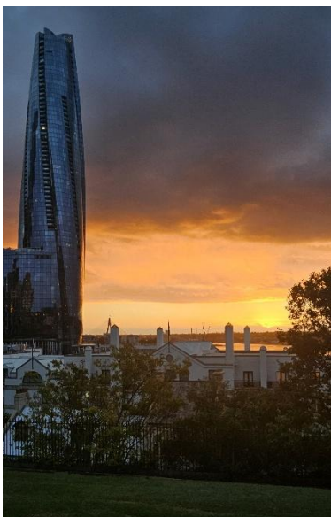
Sonnenuntergang vom Observatory Hill Park, Sydney

Wollongong liegt zudem auch nur ca. 60 Kilometer von Sydney entfernt, sodass sich die Großstadt gut von dort aus erkunden lässt. Besonders beliebt sind der Bondi Beach mit seinen großen Wellen und die für Australien typischen Rock Pools, von denen man eine gute Aussicht auf Surfer und die Brandung hat. Einzigartig sind die meterhohen Wellen, die bei Sturm gegen die Felsen schlagen und die Gischt bis in die Pools schleudern.