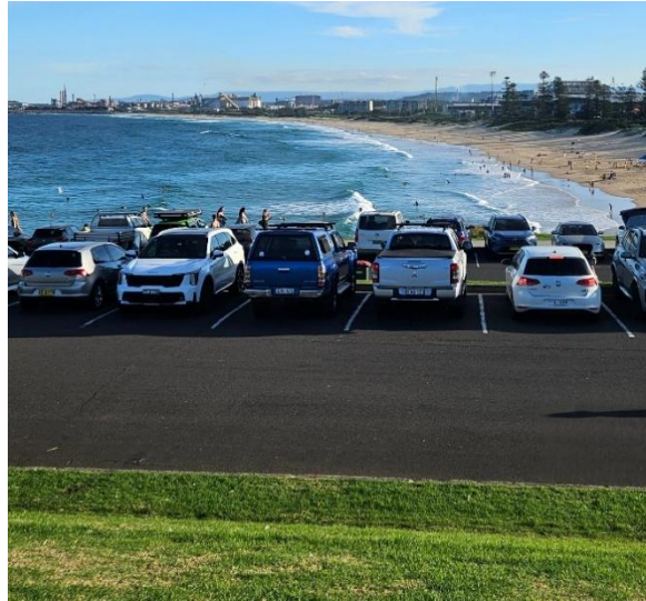
Ausblick auf den Strand von Wollongong nahe Leuchtturm

Vor der Anreise gilt es, rechtzeitig die Flüge zu buchen. Ich habe einen sehr günstigen Hinflug für ca. 680 Euro bekommen. Flüge unter 1.000 Euro sind möglich, allerdings sollte man frühzeitig buchen, eventuell flexibel beim Startflughafen sein und etwas Strapazierfähigkeit bezüglich der Reisezeit mitbringen. Bei einer günstigen Verbindung ist man mit Flügen und Umsteigen leicht über 30 Stunden unterwegs.