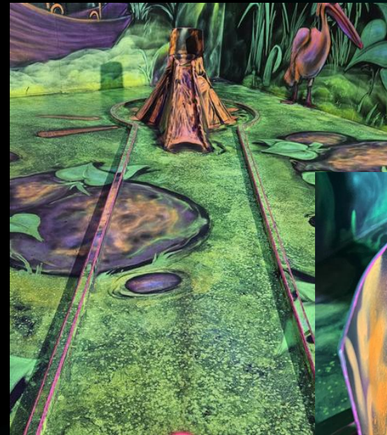
Minigolf-Bahn: „Der Vulkan“