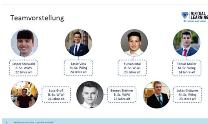
Grafik: © KAEP

Mitglieder des Projektteams „Zukunftskompass“ des 2. Jahrganges.