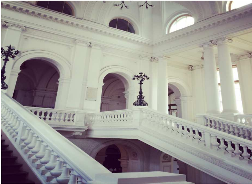
Hauptgebäude von innen

Das Hauptgebäude der Universität ist wirklich schön und imposant. Die anderen Gebäude sind dagegen eher schlicht und schon etwas älter, erfüllen aber trotzdem ihren Zweck.